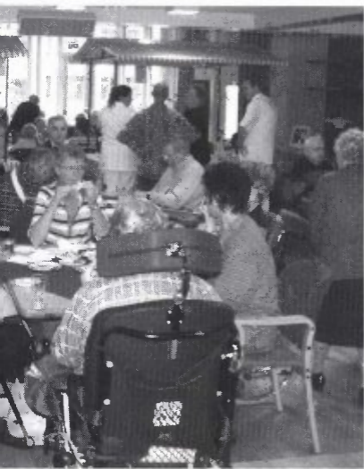
...ruikt tijdens de dag van de ouderen.

Een bijdrage van Martin Ankone en Gerard Helmink