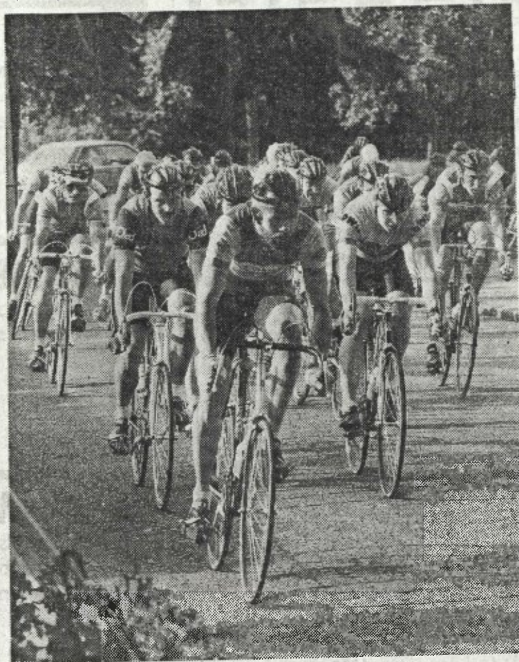
● De toertocht De Pijl van Twente op zondag 5 juni over een afstand van honderdtwintig kilometer is een gezamenlijk project van de zes toerfietsverenigingen in Noord Oost Twente

Naast de organisatie van de Pijl van Twente houden de zes deelnemende verenigingen aan het regionaal overleg zich ook bezig met allerlei andere zaken. Zo mis bij een van de eerste bijeenkomsten uitvoerig gesproken met bosbeheerders. Hierbij is van gedachten gewisseld over het gedrag van de veldrijder in natuurgebieden. Op grond van wederzijdse ervaringen stelde men vast dat het overleg tussen verenigingen en bosbeheerders goed verloopt. Veldtoertochten worden in een vroegtijdig stadium aangekondigd bij de bosbeheerders waardoor er genoeg tijd is om de gewenste wijzigingen op soepele wijze aan te brengen. Ook wordt het regionaal overleg benut om de data van de verschillende toertochten en veldritten op elkaar af te stemmen. Vrijer 7-6-94